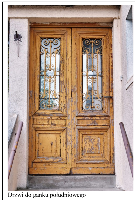
Drzwi do ganku południowego