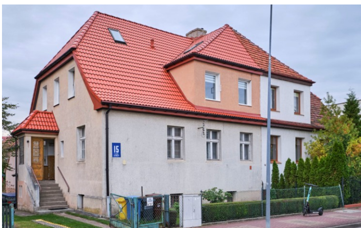
Widok ogólny od płd.-wschodu