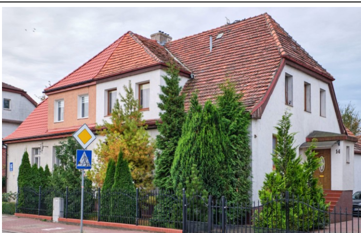
Widok ogólny od północy

7. Fotografia z opisem wskazującym orientację albo mapa z zaznaczonym stanowiskiem archeologicznym