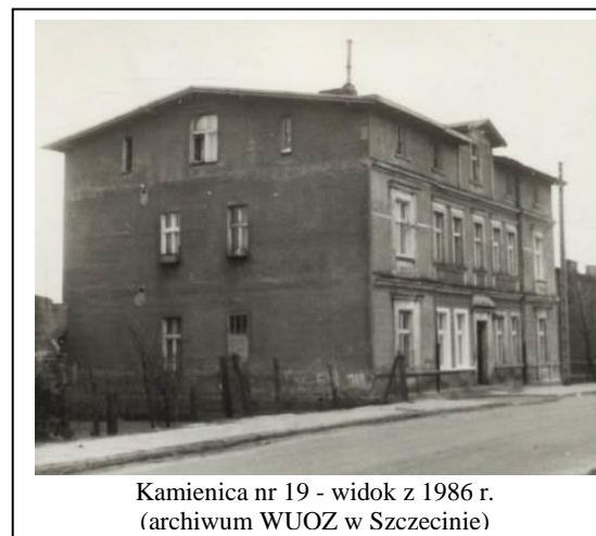
Kamienica nr 19 - widok z 1986 r.

Ochrona w zakresie zachowania: bryły budynku, wystroju architektonicznego elewacji oraz kształtu i rozmieszczenia okien.