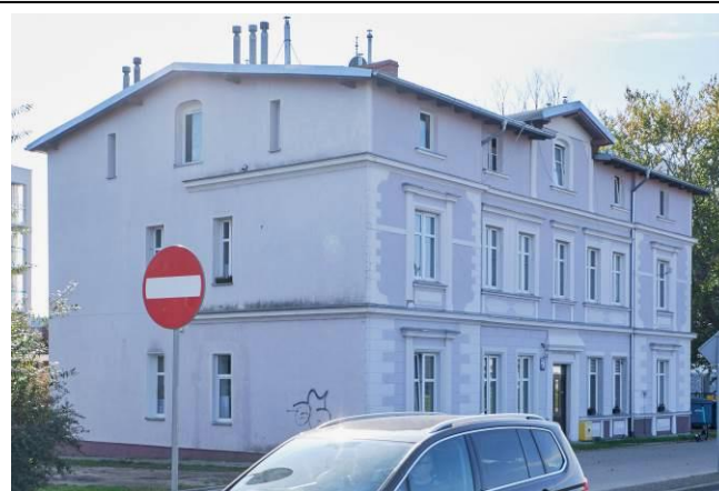
Widok ogólny bryły od strony północnej