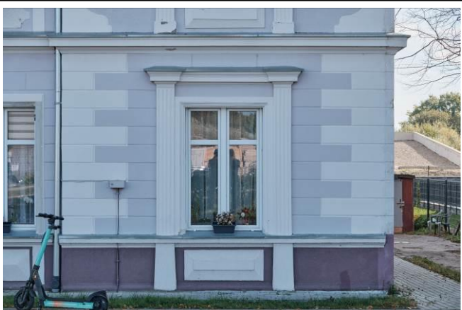
Detal architektoniczny – okno w parterze ryzalitu