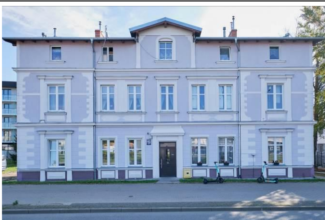
Elewacja frontowa – północno-zachodnia

7. Fotografia z opisem wskazującym orientację albo mapa z zaznaczonym stanowiskiem archeologicznym