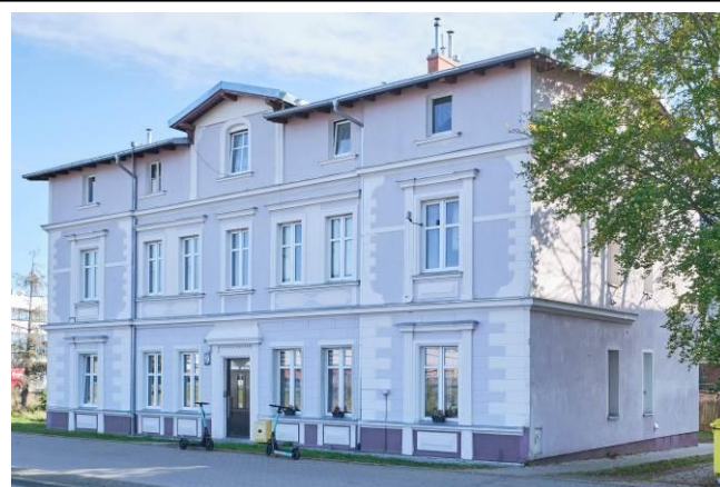
Widok ogólny bryły od strony zachodniej