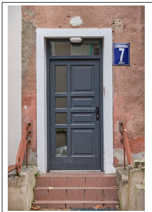
Widok na wejście frontowe do kamienicy