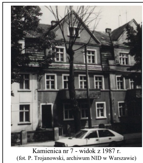
Kamienica nr 7 - widok z 1987 r.