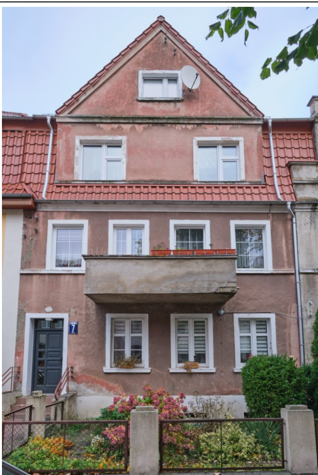
Widok na elewację frontową od zachodu

7. Fotografia z opisem wskazującym orientację albo mapa z zaznaczonym stanowiskiem archeologicznym