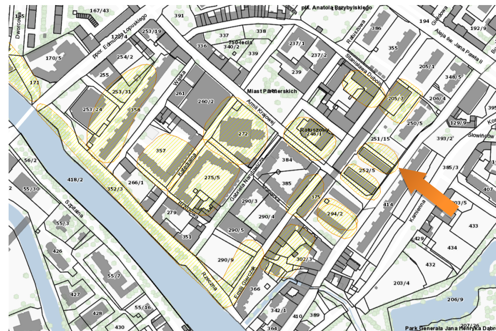
Obszar stanowiska na mapie – https://mapy.gis.kolobrzeg.pl

Ochrona polega na ograniczeniu ingerencji w grunt. Prowadzenie wszelkich prac związanych z ingerencją w grunt, w tym robót budowlanych wymaga uzyskania pozwolenia od wojewódzkiego konserwatora zabytków. W przypadku prowadzenia robót ziemnych, związanych z inwestycjami, należy przeprowadzić archeologiczne badania terenowe w niezbędnym zakresie, który zgodnie z art. 31 ustawy z dnia 23.07.2003 r. określi na wniosek inwestora wojewódzki konserwator zabytków.