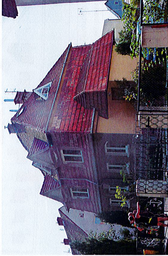
Widok budynku od północnego-zachodu