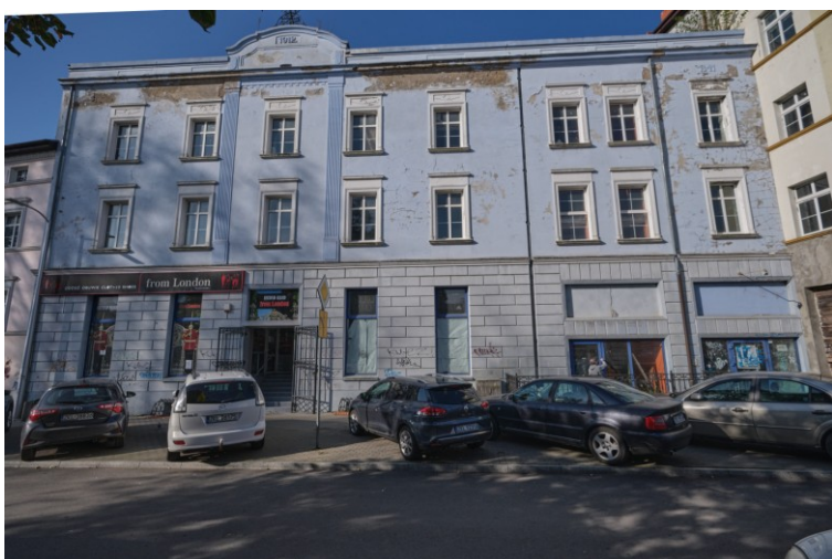
Elewacja frontowa - wschodnia

7. Fotografia z opisem wskazującym orientację albo mapa z zaznaczonym stanowiskiem archeologicznym