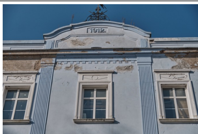
Zwieńczenie osi środkowej fasady z attyką