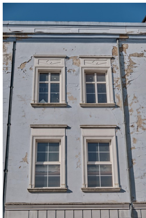
Okna II i III kondygnacji