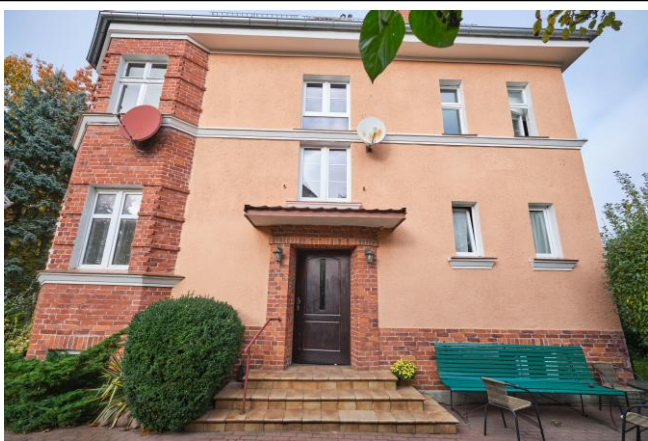
Widok elewacji południowej