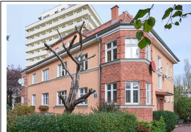
Widok ogólny bryły od strony południowo-zachodniej