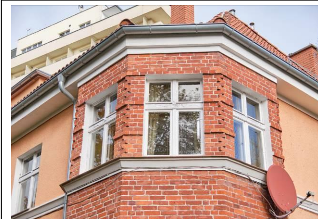
Fragment elewacji południowej, detale wystroju ryzalitu