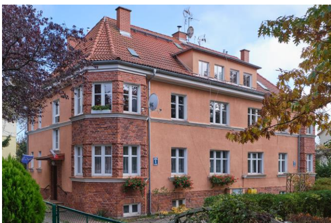
Widok ogólny bryły od strony północno-zachodniej

7. Fotografia z opisem wskazującym orientację albo mapa z zaznaczonym stanowiskiem archeologicznym