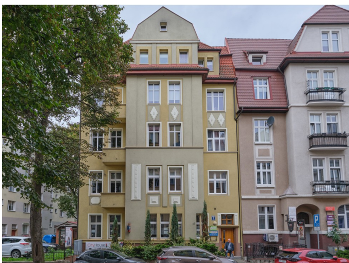
Widok frontowy kamienicy od strony wschodniej

7. Fotografia z opisem wskazującym orientację albo mapa z zaznaczonym stanowiskiem archeologicznym