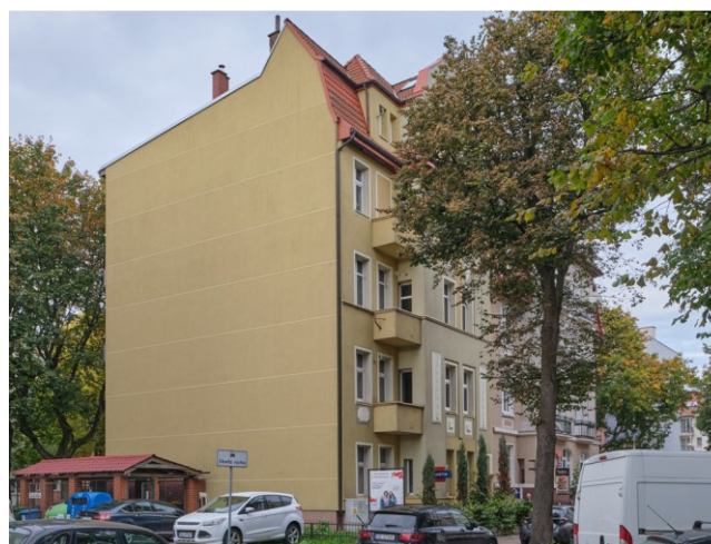
Widok ogólny bryły kamienicy od strony południowej