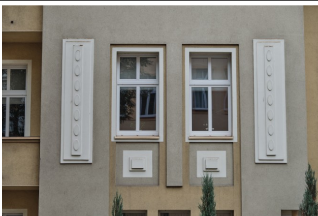
Fasada, detale wystroju tynkarskiego