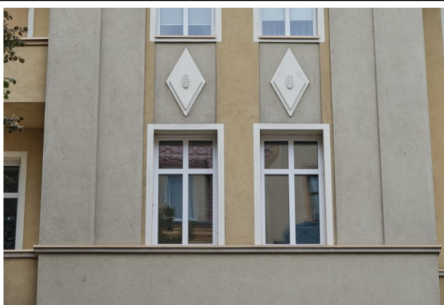
Fasada, detale wystroju tynkarskiego