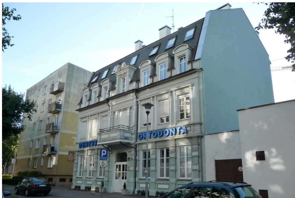
Widok budynku od wschodu

8. Fotografia z opisem wskazującym orientację albo mapa z zaznaczonym stanowiskiem archeologicznym